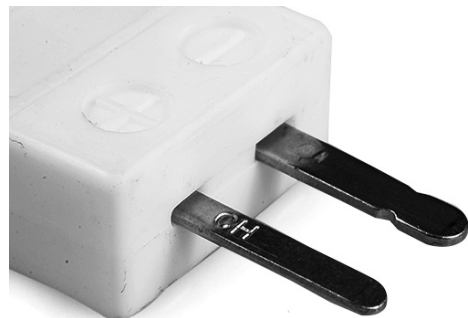
Miniature Hi-Temp Ceramic in-line Plug - HTC (dimensions in mm)

Labfacility are the UK's leading manufacturer of Temperature Sensors, Thermocouple Connectors and associated Temperature Instrumentation and stockings of Thermocouple Cables. The Company has been trading since 1971 and is ISO9001 accredited.